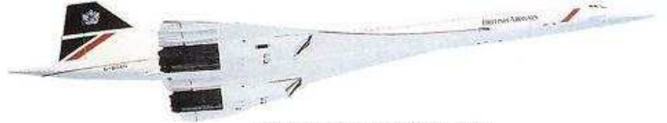
süpersonik yolcu uçağı ультразвуковой пассажирский самолет