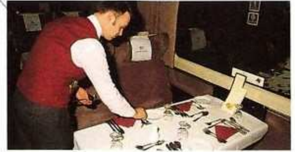
yemekli vagon | вагон-ресторан