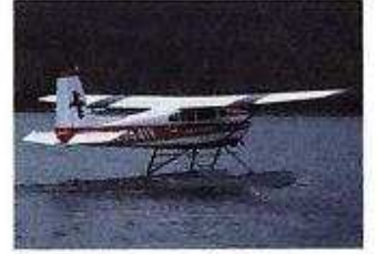
deniz uçağı гидросамолет