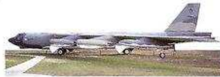
bombalama uçağı бомбардировщик