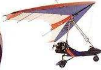
mikro uçak ультралегкий самолет