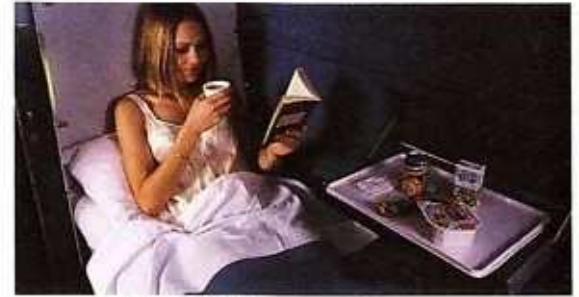
kuşetli kompartıman спальное купе