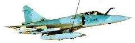
savaş uçağı военный самолет