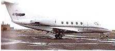
özel jet частный самолет