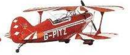
çift kanatlı uçak биплан