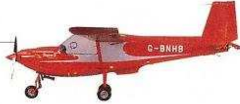
hafif uçak легкомоторный самолет